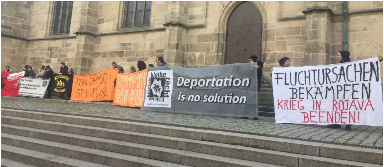
14.3.2020 – Kundgebung zur Forderung nach einem „Sicheren Hafen“ im ganzen Landkreis (Holzmarkt Tübingen)

AK Ausländerbehörde: Im Herbst 2020 gründete sich in Tübingen ein „Arbeitskreis Ausländerbehörde“. Beteiligt sind Organisationen und Beratungsstellen, die Geflüchtete und Migrant*innen beraten sowie Mitglieder des Integrationsrats und politisch aktive Migrant*innen. Anlass ist die immer wiederkehrende Unzufriedenheit mit der fachlichen Arbeit und dem Umgangston in der Tübinger Ausländerbehörde. In einem Artikel im Schwäbischen Tagblatt wurde die Kritik des Bündnisses öffentlich gemacht. Die Ausländerbehörde selbst sieht Probleme in der räumlichen und finanziellen Ausstattung der Behörde.