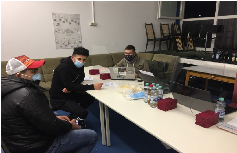
Beratung in Mössingen unter Corona-Bedingungen